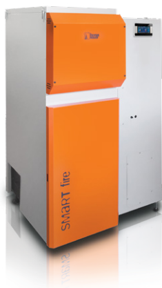
* wybrane modele lub za opłatą