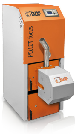
* wybrane modele lub za opłatą