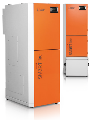
* wybrane modele lub za opłatą