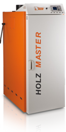
* wybrane modele lub za opłatą