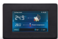
Panel pokojowy dotykowy Ester X80 bezprzewodowy