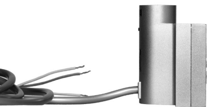
kabel prosty bez wtyczki